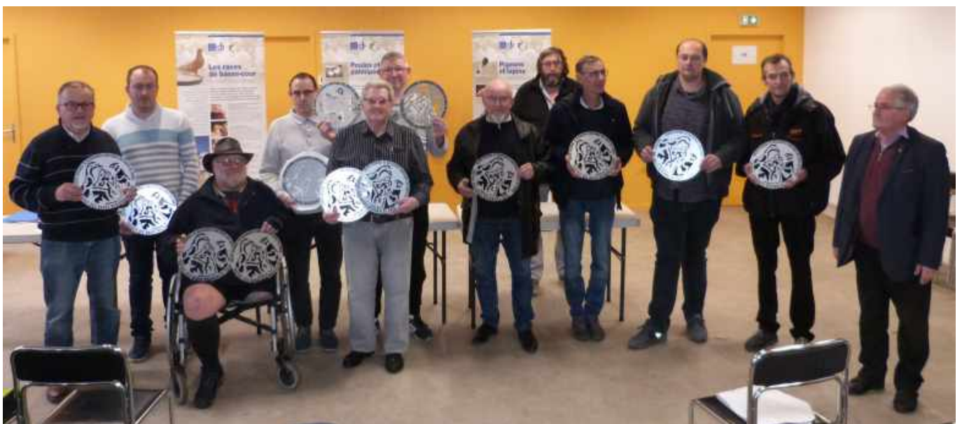
Trophée des Races Régionales 2019